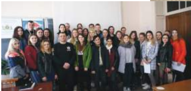
ОБГОВОРЕННЯ ПРОБЛЕМИ «МИ ПРОТИ БУЛІНГУ»

Формуванню почуття власної гідності, моральної свободи, здатності самостійно робити моральний вибір відповідають такі форми роботи Інституту культури, як тематичні бесіди, диспути