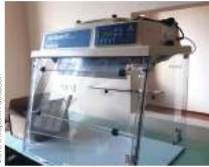
ІННОВАЦІЙНЕ ОБЛАДНАННЯ ЛАБОРАТОРІЇ

Насправді, я не очікував, що мій допис так сколихне інформаційний простір