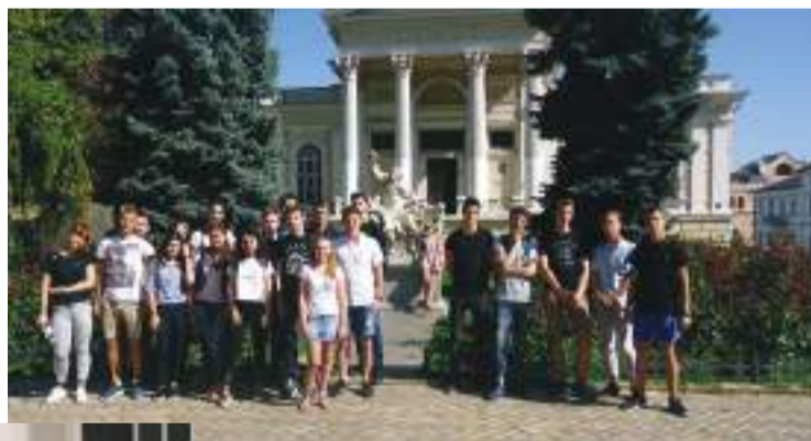
ВІДВІДУВАННЯ АРХЕОЛОГІЧНОГО МУЗЕЮ (М. ОДЕСА)

Діяльність Інституту культури і мистецтв спрямована на підготовку висококваліфікованих, гармо-